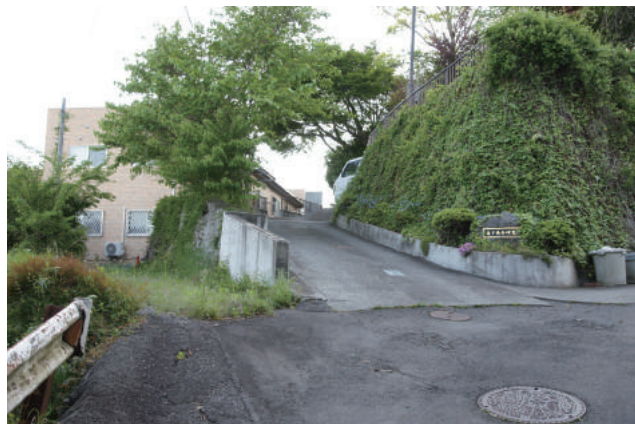
坂道を上ると、左手に米寿庵、右手に森下長寿研究所があります